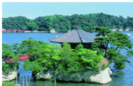
松島のシンボル・五大堂