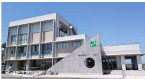
亶理町 鳥の海ふれあい市場